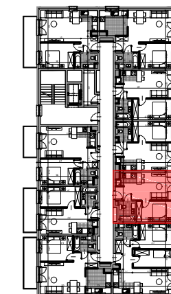
III PIĘTRO SCHEMAT LOKALIZACJA MIESZKANIA