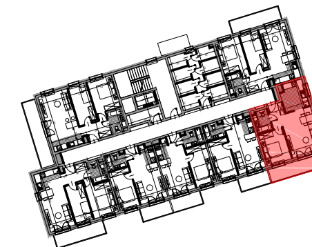
I PIĘTRO SCHEMAT LOKALIZACJA MIESZKANIA