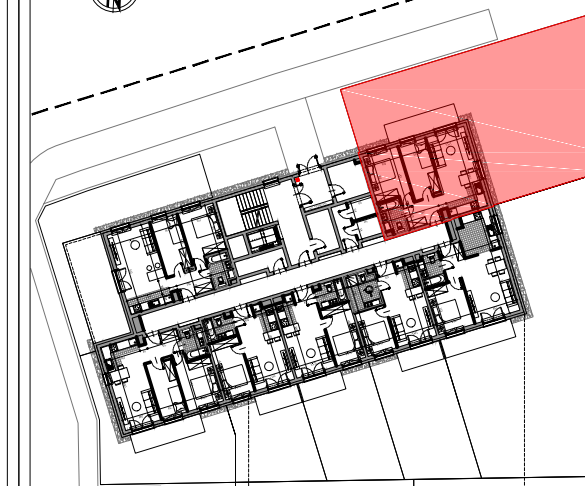
PARTER SCHEMAT LOKALIZACJA MIESZKANIA